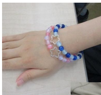
ビーズ手芸の 完成品

「ステップワーク東海」では、他にもいろいろな作業を行っているそうです。「就労に興味がある方はいつでも見学や体験の相談にも応じます。」と仰っていただきました。