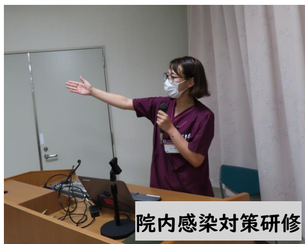
院内感染対策研修