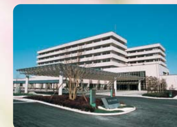
▲松阪中央総合病院