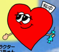
看護部マスコットキャラクター 真心(まごちゃん)